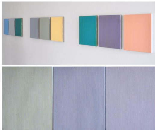
Keummi Paik-Bauermeister: Öl und Acryl auf Leinwand

Farbe, Linie, Fläche sind die Grundelemente von Malerei und Zeichnung – zwei der klassischen bildenden Kunstformen, die im Mittelpunkt unserer Frühjahrsausstellung stehen. Die beiden gezeigten Künstler arbeiten reduziert, mit verschiedenen Mitteln und doch einer ähnlichen künstlerischen Sprache.