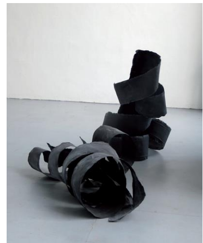
Daniel Erfle, Papierplastiken aus der Serie „Strandgut“, 2014

Beide Künstler verbindet das Erkunden von Räumen, Körpern und einer abstrakten Formensprache sowie die Reflexion der jeweils verwendeten Medien.